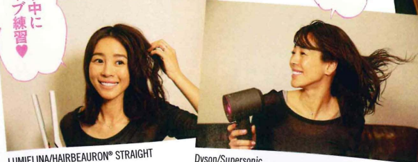
LUMIELINA/HAIRBEAUZER® STRAIGHT Dyson/Supersonic