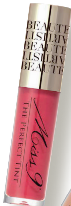
ミスナイン パーフェクトティント 01(ベリーベリア) 4,400円(税込)