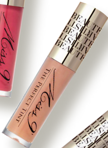
ミスナイン パーフェクトティント 02(フランゴ) 4,400円(税込)