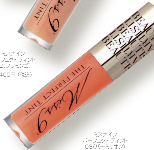
ミスナイン パーフェクトティント 03(パーミリオン) 4,400円(税込)