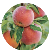
リンゴ幹細胞エキス*1※5