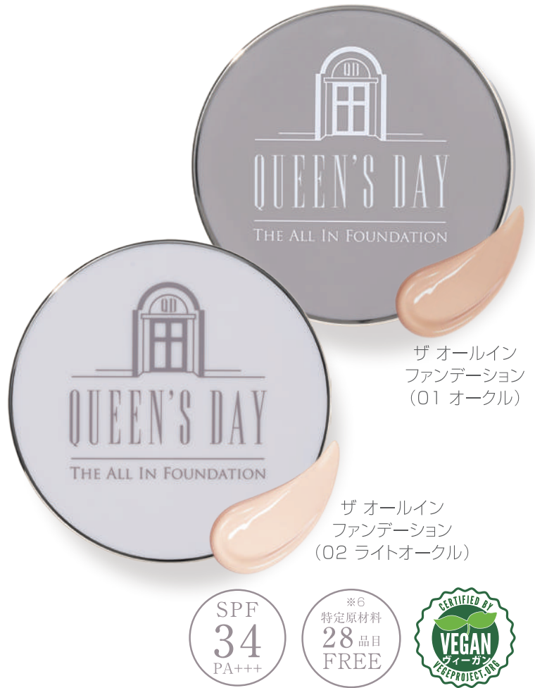
ザ オールイン ファンデーション (01 オークル)