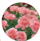
カーネーション エキス ※3※4