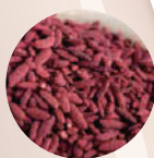
黒米紅麹菌 発酵エキス ※2※4