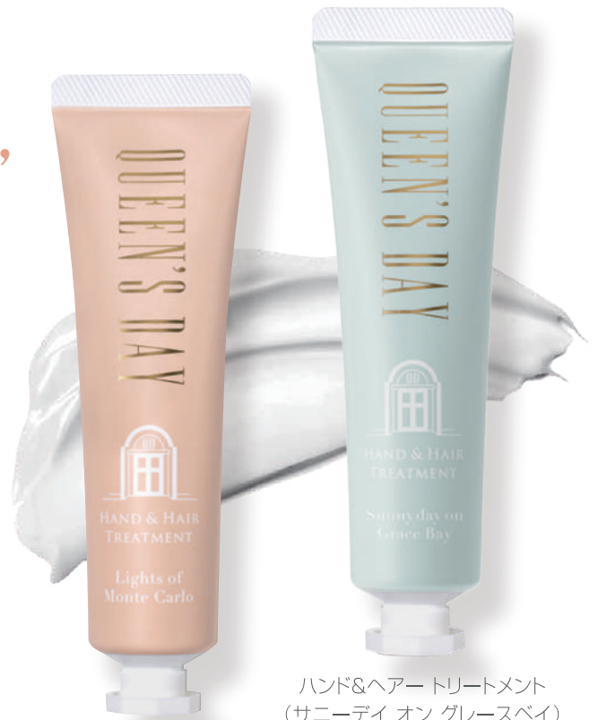
ハンド&ヘアトリートメント (サニーデイ オン グレースベイ)