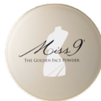
03 (クリアベージュ) 6,050円(税込)

パウダーの良さを最大限に引き出す「高度精製処理マイカ」「天然シルク」「オーガニックオイル」「トーンアップ成分」を厳選配合。各成分の合わせ技により、なりた肌を自由自在にコントロール。くすみ・テカリ・ヨレ・毛穴など時間経過とともに気になる肌悩みも一気に解消します。